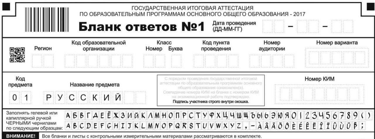
Рис. 1. Верхняя часть бланка ответов № 1

В верхней части бланка ответов № 1 (рис. 1) расположены поля для заполнения участником ОГЭ, поле для подписи участника ОГЭ, строка с образцами написания символов.